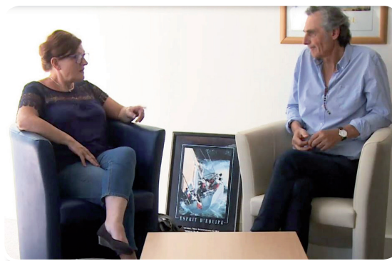
Un travail d'équipe

Un recrutement départemental en lien avec les établissements psychiatriques du secteur.