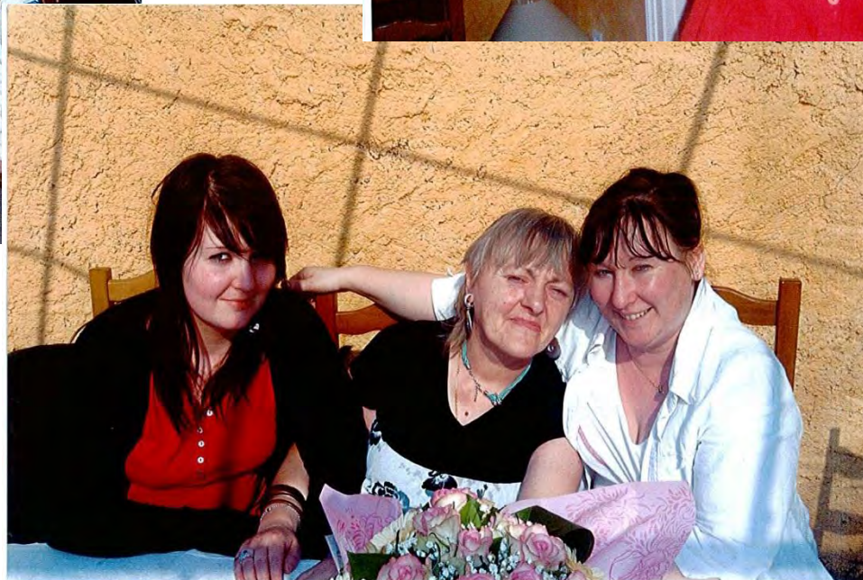
11 èmes Journées du GREPFA-France - Aix-en-Provence - 12/13 juin 2014 Accueillir n'est pas adopter! Et pourtant...